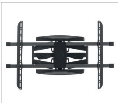
VESA-Aufnahme bis max. 900 x 600 mm