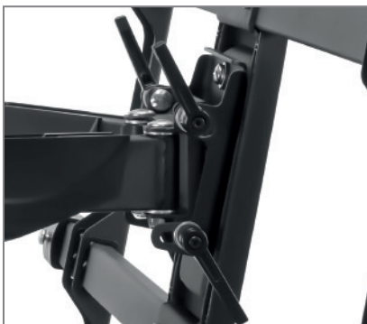
werkzeuglos justierbarer Neigungswinkel