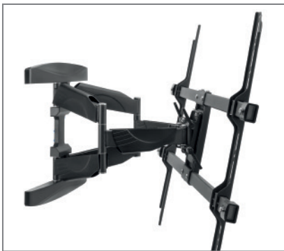
min. 68 bis max. 508 mm Wandabstand